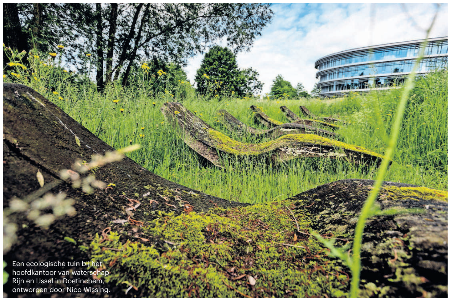
Een ecologische tuin bij het hoofdkantoor van waterschap Rijn en IJssel in Doetinchem, ontworpen door Nico Wissing.